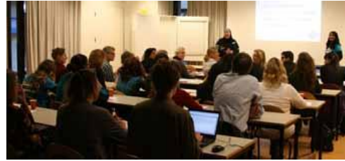
Afbeelding 1: Workshop “Kansen sociale media”

Sociale media is niet meer weg te denken uit het leven van alledag. In de huidige internetwereld hoor je de term vaak vallen, maar wat is dat nou precies? Sociale media is een verzamelnaam voor platforms waarop mensen onderling contact hebben en ervaringen uitwisselen. Meer dan 73% van de jongeren is actief op ten minste één sociale netwerksite zoals Facebook, Twitter of Hyves.