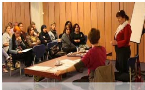
Afbeelding 3: workshop 2,

Conclusie In geval van eerkwesties kijkt men vaak door een 'westerse' bril vanuit de ik-mentaliteit en er is weinig begrip voor de wij-mentaliteit van andere culturen. Het is belangrijk dat een hulpverlener nadenkt over de stappen en de meldroute naar deskundigen (wie moet worden betrokken bij dreiging van eengerelateerd geweld, verstoting of gedwongen uithuwelijking en achterlating in het land van herkomst voordat zij/hij geconfronteerd wordt met de vraag.